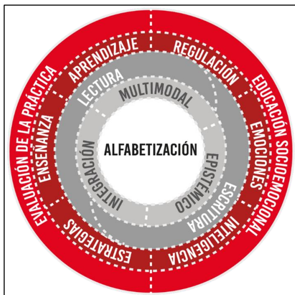
Figura 1. Modelo del PI-APDES.