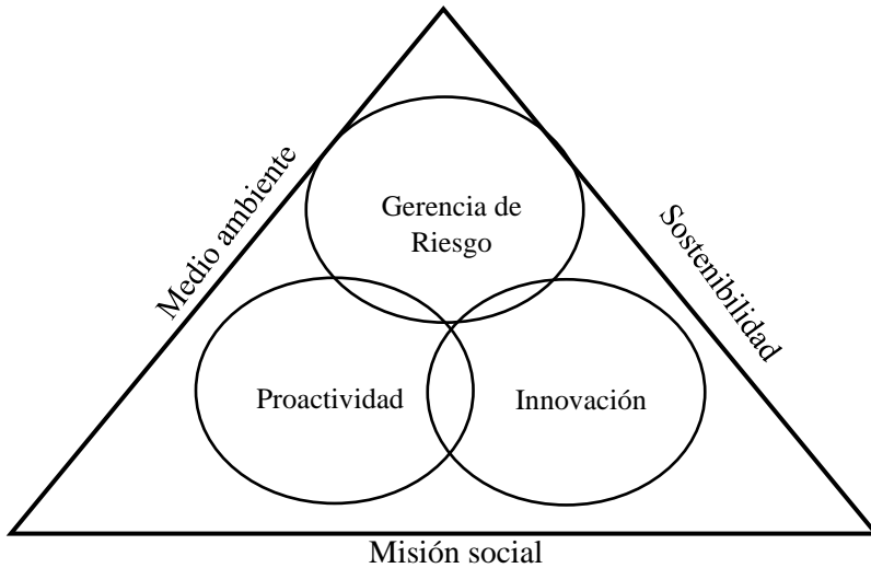
Figura 1. Modelo multidimensional de emprendimiento social de Weerawardena y Sullivan.

Fuente: Elaborado por Briceño et al., (2017).