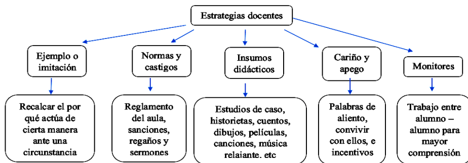
Figura 2. Estrategias docentes.