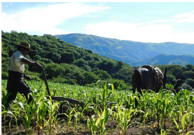
Figura 6.

“...Pero ya la mayoría parece que está perdiendo la semilla, porque no se da, nadie siembra pue ya, si no hay riego, llueve tarde y no se logra.”