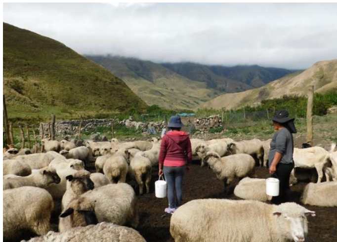
Figura 7.

La ganadería está basada en un esquema de ganadería trashumante, dependiendo principalmente de los pastos naturales. Para que se pueda contar con rendimiento, las familias de la comunidad que crían animales administran estos pastos y optimizan el uso de este recurso, a partir de una movilidad en el territorio vinculada de manera estrecha con los tiempos de lluvia y seca. Antes de iniciar la temporada de seca (invierno), las familias realizan un cambio de casa, y se van vivir a los puestos junto con todo el ganado y habitan durante seis meses en las partes más bajas de su territorio que son más húmedas. Este cambio permite la regeneración de las pasturas cerro arriba. Cuando comienza la temporada de lluvias (verano), habiéndose recuperado los pastos en las zonas altas, se dejan los puestos de invierno y se regresan a las casas que están ubicadas cerro arriba. De esta manera, los pastos que se utilizaron durante el invierno, tendrán la oportunidad de renovarse para el siguiente año. Esta práctica les permite garantizar alimento para el ganado en todo momento, aunque también algunas familias comienzan a innovar con el sembrado de forrajes que permitan complementar la dieta de los animales, sobre todo en los días más crudos del invierno.