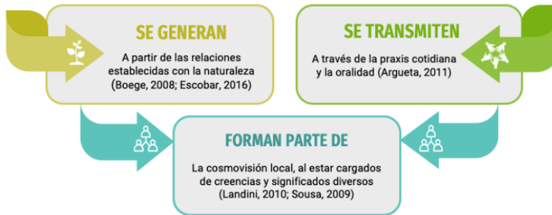
Figura 2. Prácticas y saberes locales.

Fuente: Argueta, 2011; Boege 2008; Escobar, 2016; Landini, 2019, Sousa, 2009.