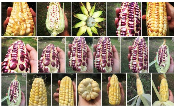
Figura 5. [Fotografía de Karla Pérez D.].

“La parte donde yo vivo, tengo varios sembraditos, lo último que he sembrado está un poquito más grande todo tiernito, lo otro ya está todo amarillo, casi maduro, está lindo.”