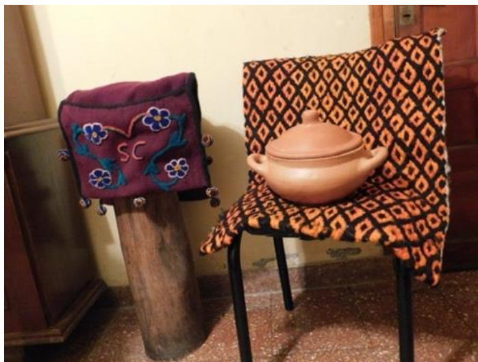
Figura 4 [Fotografía de Karla Pérez D.]

Fuente: (Salta, 2019) Archivo fotográfico personal, Argentina.