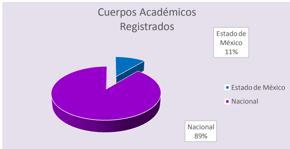
Figura 1.- Cuerpos Académicos Registrados en las Escuelas Normales (2016).

Una de las características de este programa es promover la integración de cuerpos académicos a fin de generar colectivos docentes que compartan una línea de generación y aplicación del conocimiento (LGAC) contribuyendo así en el caso de las escuelas normales a la mejora continua en la formación docente; sin embargo la evolución de los cuerpos académicos ha sido un proceso lento en el Estado de México en comparación con las universidades, el 41 % de las escuelas normales a nivel nacional tienen registrados cuerpos académicos; de ese 41% el 11% corresponde a las escuelas normales del Estado de México, como puede verse en la siguiente figura, conforme datos PRODEP 2016 (Figura 1).