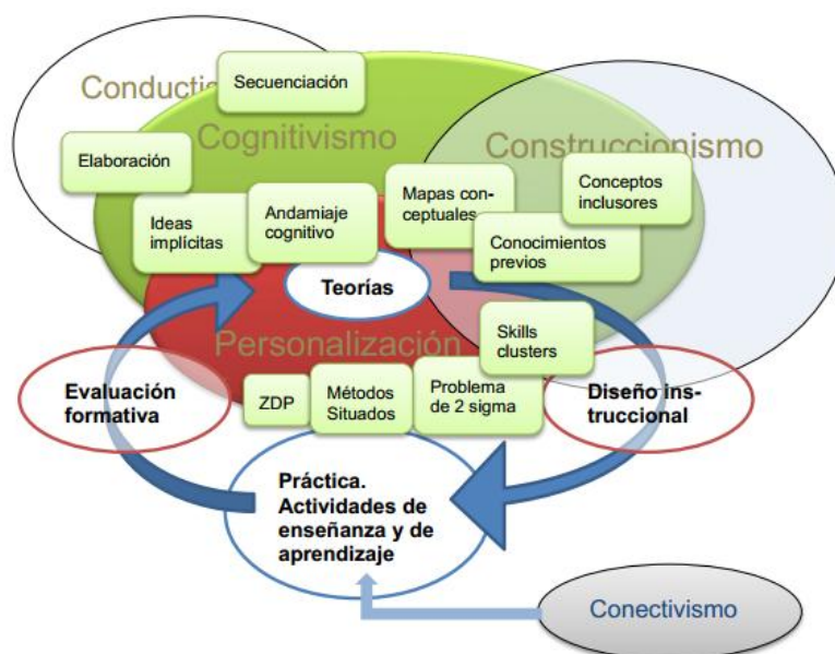
Figura 1. -Teorías que ilustran el diseño instruccional (Zapata, 2015a).

Ahora bien congruente con esta evolución de los MOOC resultó pertinente el estudio de las diferentes teorías del aprendizaje: conductismo, cognitivismo y construccionismo que proporcionan la bases en la cual se apoya la secuenciación de contenidos y todos los elementos del diseño instruccional, es decir las diferentes teorías del aprendizaje, representan diferentes posturas ante el conocimiento y en consecuencia la organización de los contenidos tiene que estar alineados o responder a una teoría (o varias) que la fundamenta y que la explica tal como se representa en la Figura 1 :