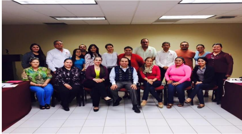
Figura 4.- Asistentes a la segunda sesión.