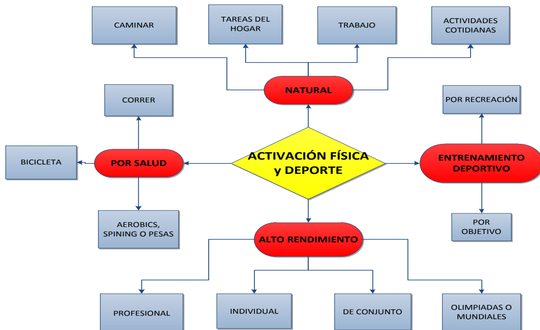
Figura 1.- Actividad física y deporte.

Existen diferentes clasificaciones de activación física (Ariasca, 2002). Para la presente investigación se han establecido diferentes modalidades de activación física y deporte; en la Figura 1 se pueden apreciar cuatro modalidades: Natural, por salud, entrenamiento deportivo y alto rendimiento.