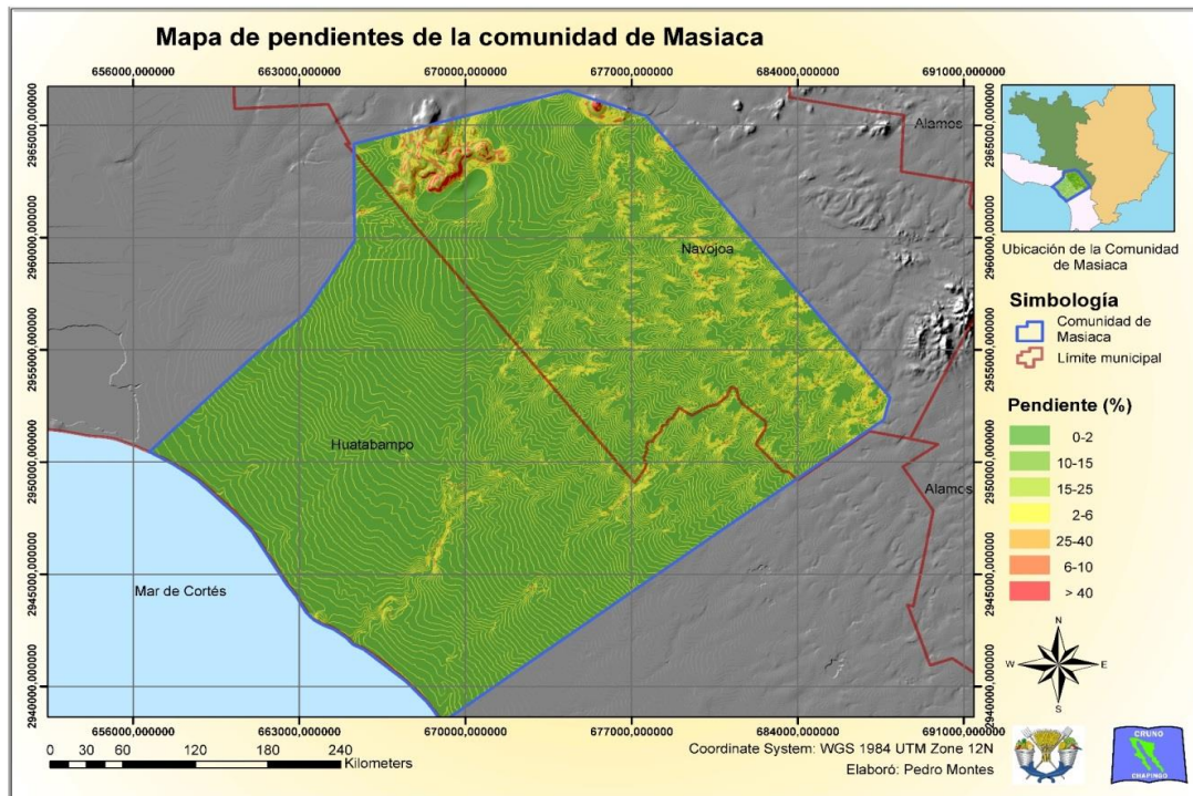
Figura 1.- Mapa de pendientes registradas en la Comunidad de Masiaca, Sonora.

Dicha comunidad se encuentra dentro de la Provincia Fisiográfica de la Llanura Costera del Pacífico, en la Subprovincia Fisiográfica de la Llanura Costera y Deltas de Sonora y Sinaloa; posee una superficie de 46,480 hectáreas. Su localización geográfica está entre los 26°45' de Latitud Norte y los 109°13' de Longitud Oeste. Por ubicarse dentro de la Planicie Costera el territorio de la comunidad se encuentra casi en su totalidad con pendientes ligeras menores al 6% como se aprecia en la Figura 1 ; con solo una elevación relativamente importante al norte, todo el territorio se encuentra en una altitud de 270 msnm.