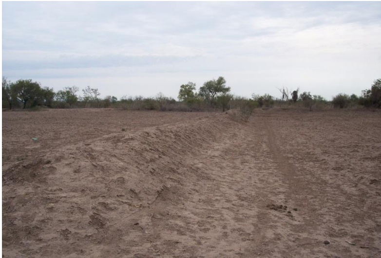
Figura 5.- Terreno con las bolsas listas para el almacenamiento del agua.

El manejo del agua en parcela presenta dos variantes detectadas; una de ellas consiste en que el productor mantenga el agua en el terreno durante dos días y después le abre una compuerta en la parte más baja del terrenos para desaguar y lograr mayor uniformidad al momento en que de punto el suelo; claro está, ello depende del conocimiento que tiene el productor de su terreno; es decir, si juzga conveniente el desagüe en función de la capacidad de retención de humedad que presente dicho predio; ya que esto le permitirá con cierta seguridad llegar con esa humedad residual hasta la cosecha del cultivo que establezca.