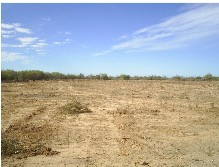
Figura 6.- Terreno abierto al cultivo en el cercano al Coteco.

Respecto al contenido de nitrógeno por lo mismo también es bajo, ya que en tres de las cuatro muestras sus valores son menores a los 90 kg/ha, cantidad que representa el mínimo necesario para obtener un rendimiento mínimo de tres toneladas en maíz, ya que técnicamente se estiman requerimientos de aproximadamente 27 kg de nitrógeno nítrico por tonelada de rendimiento, esto sin considerar la pérdida por lixiviación que se tiene al infiltrarse el agua embolsada. Otra característica en este parámetro es que sus valores presentan una tendencia a incrementarse a medida que se avanza hacia el área más plana, lo cual puede tener relación quizá con el remanso del agua o bien con una mayor cobertura vegetal de los terrenos abiertos al cultivo.