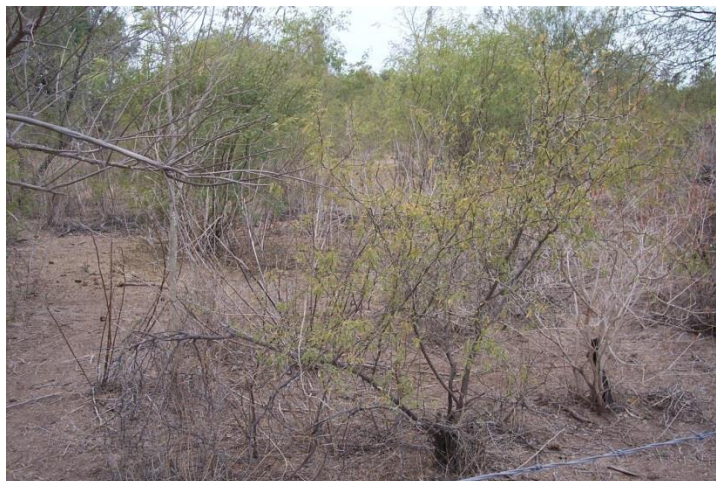
Figura 4.- Características físicas de los terrenos con potencial agrícola.

incorporar el área de interés a la producción agrícola bajo esta técnica. Parte de estas características se muestran en la Figura 4 .