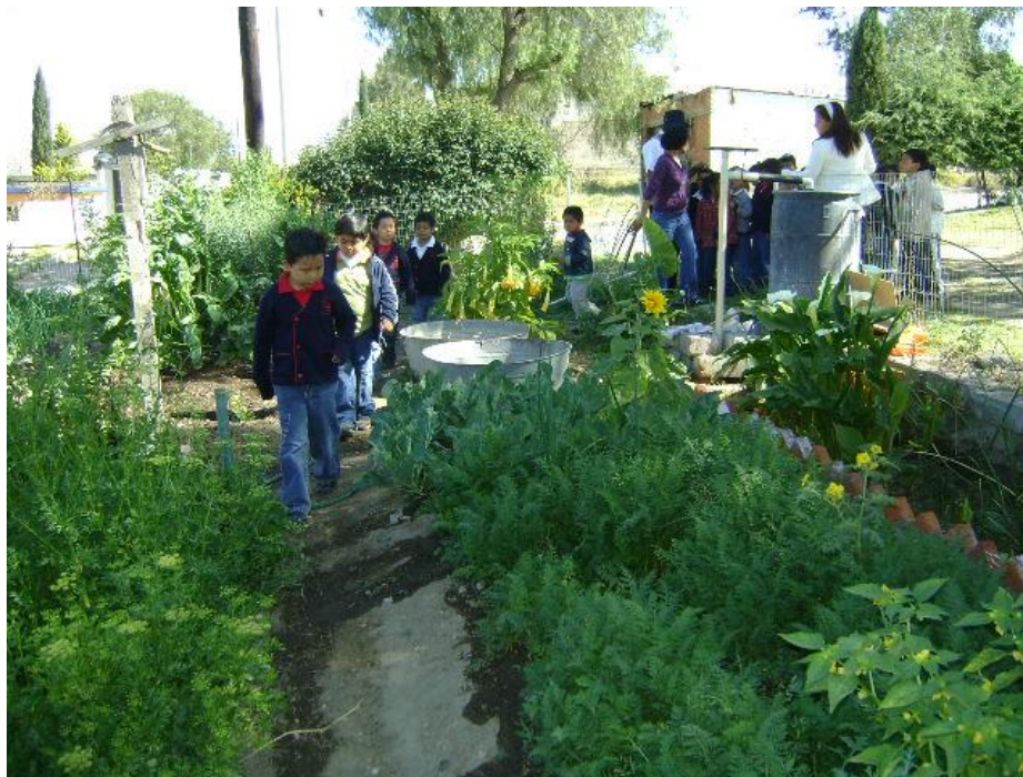
Figura 3. Práctica escolar en el huerto

Cuando se implementó el huerto como estrategia educativa, nos planteamos objetivos: educativos ( aprender-haciendo ), ambientales y nutricionales (Tello et al , 2011). El huerto que se estableció al inicio de este proceso tiene alrededor de 200 m 2 , sus componentes principales son la fuente de abastecimiento de agua, las camas de producción y el área de composteaje. El método de producción utilizado es el biointensivo propuesto por Jeavons (2002). El huerto ha significado un espacio para poner en práctica principios teóricos y metodológicos que supone la Agroecología, pero al paso de los ya casi cinco años de trabajo, se ha visto la necesidad de ir consolidando un marco de referencia pedagógico que cubra la experiencia; es así que encontramos en la ecopedagogía o pedagogía de la tierra los elementos para la promoción del aprendizaje del sentido de las cosas a partir de la vida cotidiana, pues el huerto supone un espacio que se incorpore como una necesidad y actividad de nuestro trabajo constante (Figura 3). Y también encontramos desde la Permacultura una serie de valores éticos y de diseño, tal y como ya se describieron, que nos van dando pauta para planear las acciones. De esta manera, abrimos nuestra mente para ser receptora de todo el trabajo intelectual que se desarrolla en todas las esferas del conocimiento y que consideramos pueden ser útiles, y sobre todo llevarlas a la práctica para seguir impulsando esta estrategia educativa.