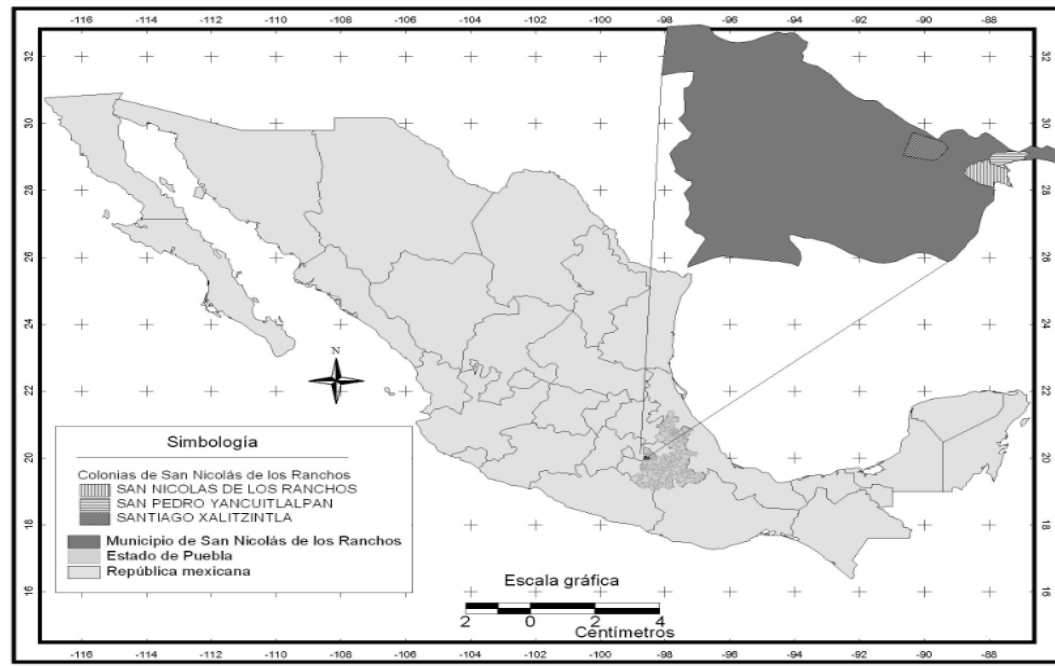
Figura 1.- Ubicación geográfica del municipio de San Nicolás de los Ranchos, Puebla, México.

Fuente: INEGI, 2010. Elaborado por Kenia Cuatecontzi Morales, 2011.