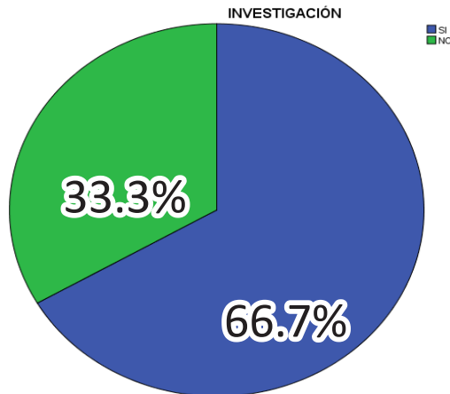
Figura 2, Realización de investigación